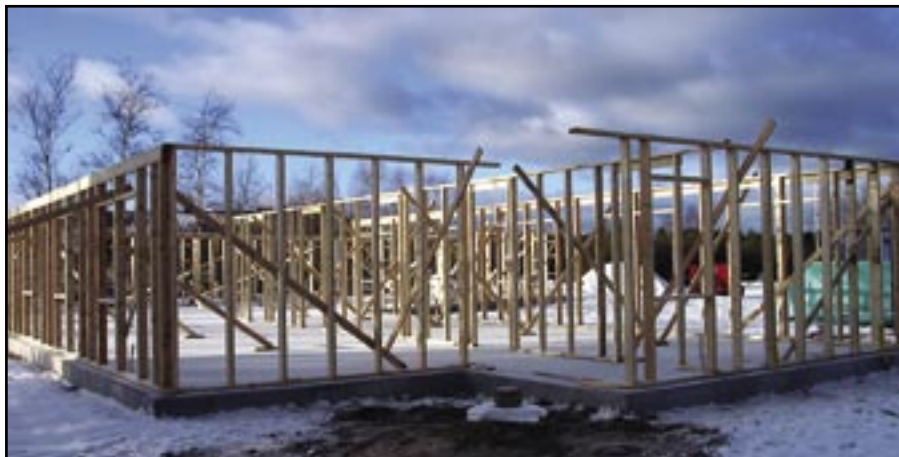
På Töllstorpsområdet i Gnosjö pågår byggnationen av kommunens nya vandrarhem. Lagom till O-ringen i sommar ska byggnaden stå klar.

tidsboende. Tanken är att de långtidsanpassade rummen ska kunna hyras ut till personer som t.ex. är i trakterna kring Gnosjö för att prova ett nytt arbete