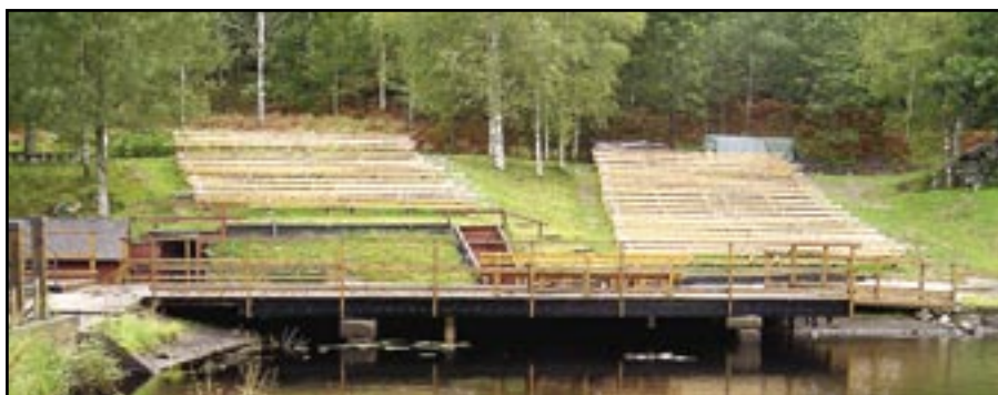
Till sommaren kommer bänkarna vid Hyltens industrimuseum fyllas med publik som vill se Gnosjö teaterförenings framförande av pjäsen "Fem kilometer av evigheten".

Under sommaren 2005 framför Gnosjöns teaterförening den nyskrivna pjäsen - Fem kilometer av evigheten, på teaterarenan vid Hyltens industrimuseum.