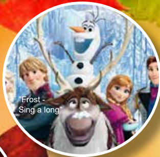
"Frost - Sing a long"