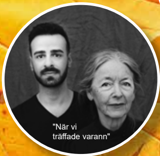
"När vi träffade varann"