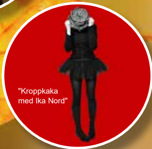
"Kroppkaka med Ika Nord"

Gnosjö scenkonst, Gnosjö folkbibliotek och Hammargården bjuder in till en vecka späckad med scenkonst – teater, film, komedi, allsång, dans mm. Praktisk information om biljetter och anmälan till workshops hittar du på www.gnosjohostfestival.se . Välkomna till Hammargården!