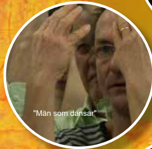
"Män som dansar"