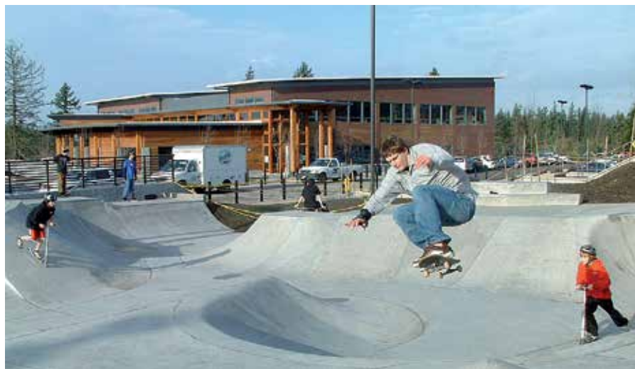
Så här kan en skatepark se ut. I augusti kommer en liknande anläggning att finnas i Gnosjö.

Nu är planerna i full gång för att bygga en skatepark i Gnosjö. Önskemålet har kommit från ungdomar i kommunen, inte minst från den aktiva skateföreningen Pancake. Utformningen av skateparken är tänkt att likna en stadsmiljö. Det ska påminna om de hinder som dyker upp om man skatar i en urban miljö, så kallad "street"-skating.