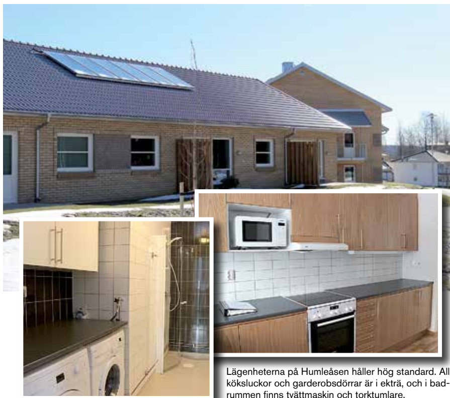
Lägenheterna på Humleåsen håller hög standard. Alla köksluckor och garderobsdörrar är i ekträ, och i badrummen finns tvättmaskin och torktumlare.

Lägenheterna förvaltas av det kommunala fastighetsbolaget Järnbäraren AB.