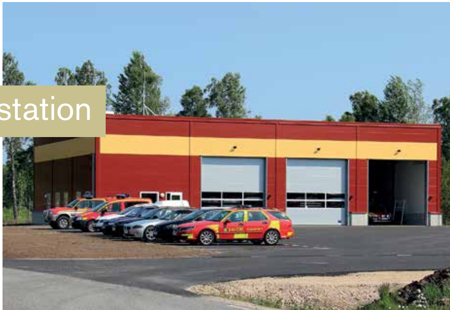
Räddningstjänsten finns nu i nya lokaler utmed Kävsjövägen i Hillerstorp.

I början av juni var det invigning av en ny räddningsstation i Hillerstorp. Stationen ligger som tidigare utmed Kävsjövägen, men den nya placeringen är närmare väg 152.