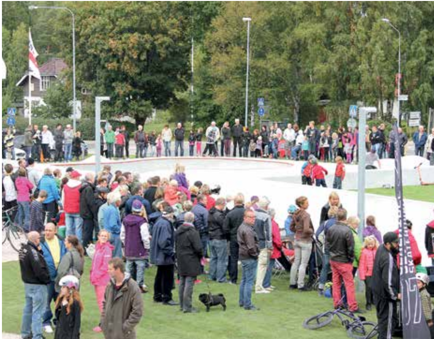
Skateparken, som ligger utmed Järnvägsgatan i Gnosjö, tilldelades årets arkitekturpris.